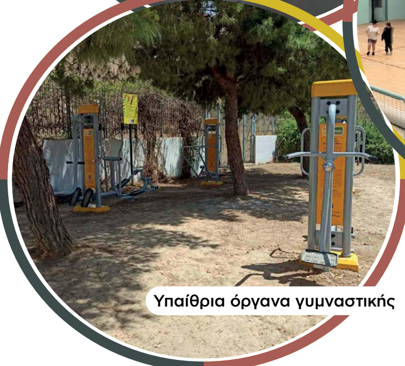
Υπαίθρια όργανα γυμναστικής