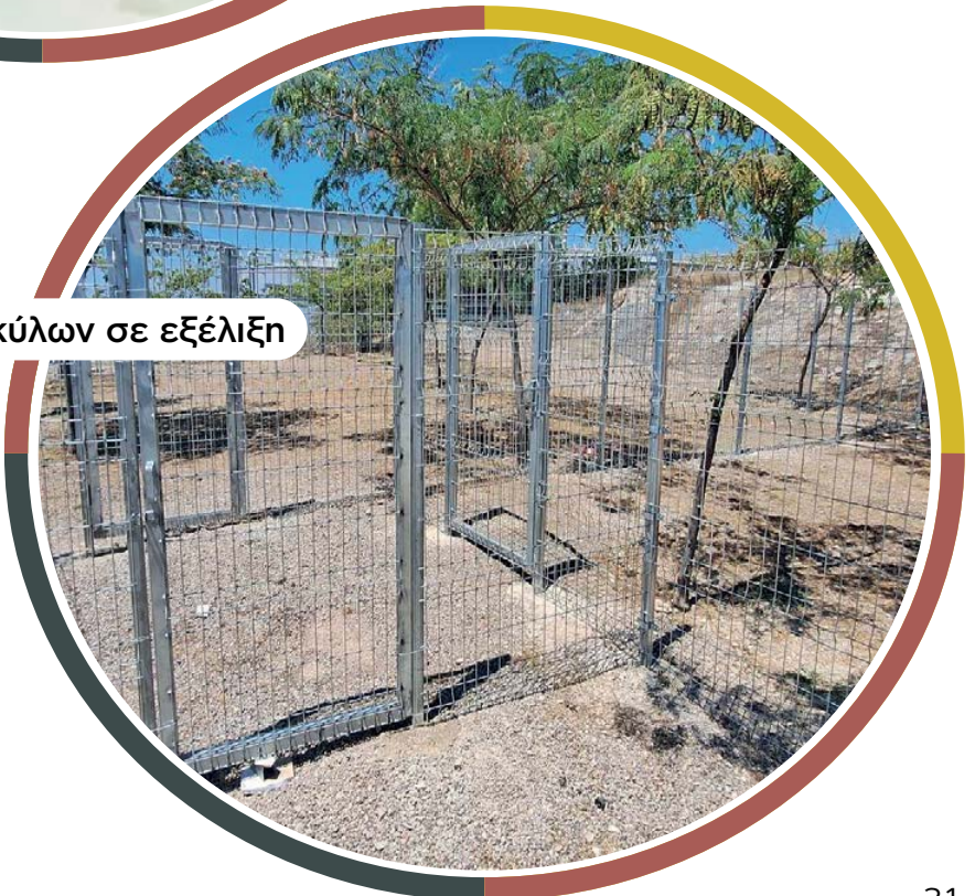
Δημιουργία πάρκου σκύλων σε εξέλιξη