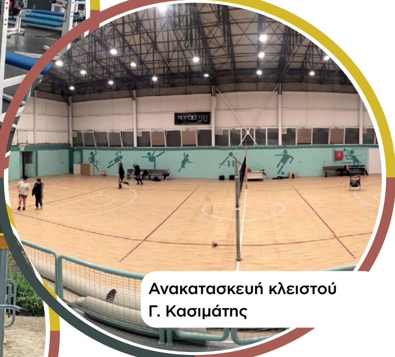
Ανακατασκευή κλειστού Γ. Κασσιμάτης