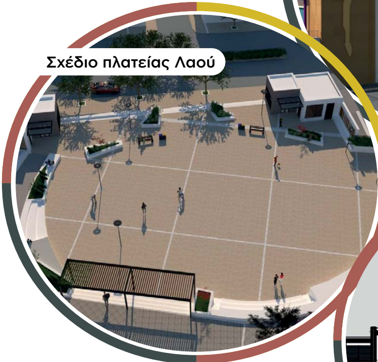
Σχέδιο πλατείας Λαού