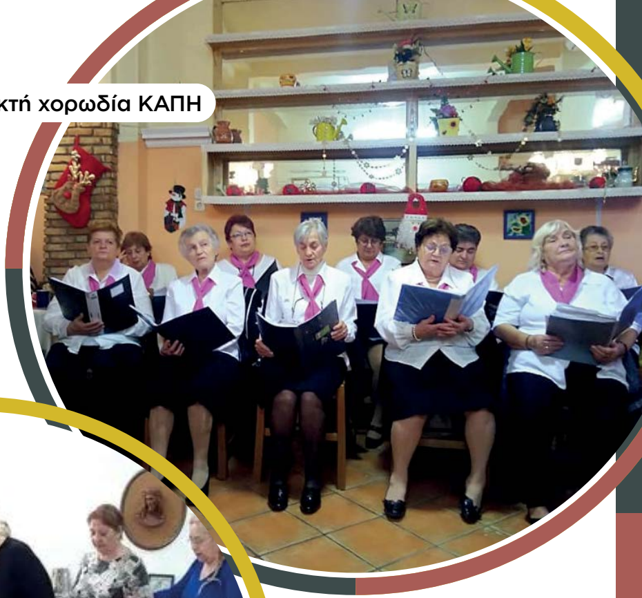
Μικτή χορωδία ΚΑΠΗ