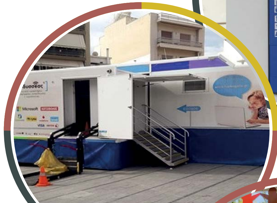
Αιμοδοσία στην πλατεία Κύπρου