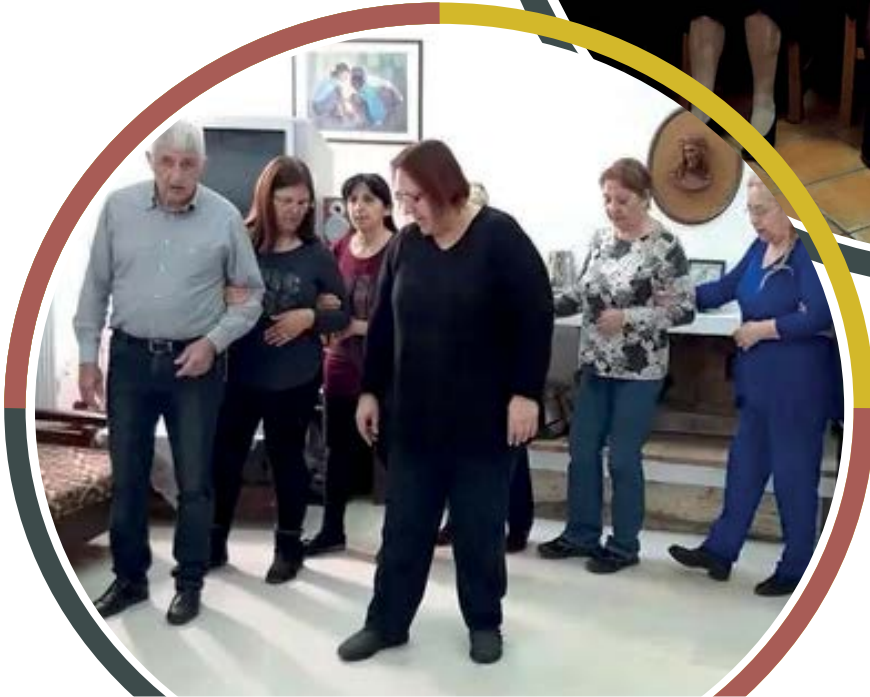
Μάθημα παραδοσιακών χορών ΚΑΠΗ