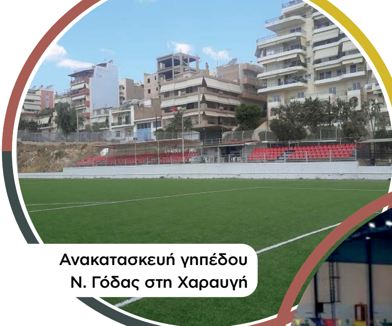
Ανακατασκευή γηπέδου Ν. Γόδας στη Χαραυγή